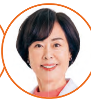
はたの 君枝 前衆院議員