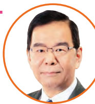
志位 和夫 党委員長・衆院議員