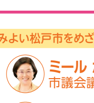
ミール かずえ 市議会議員