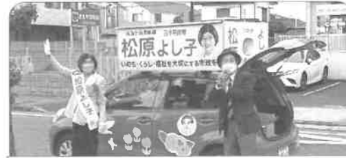
松戸の鳴村市議会議員が期間中、ずっと支えてくれました

とても、残念なことです。4年後には、必ず複数名が立候補できるように、頑張りますので、今後の皆様のご支援を、どうぞよろしくお願いたします。