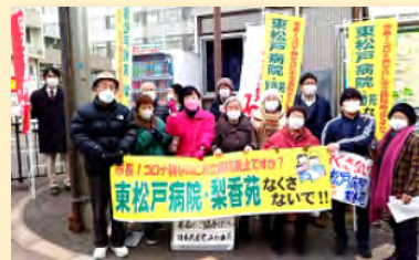
「存続させる会」の皆さんとともに

コロナ禍で命を守った砦(とりで)の公立病院。国の公立病院削減と一体の市立東松戸病院・梨香苑廃止は許せません。最後まで病院存続を求めるとともに、勝手な土地売却を許さず、回復期・慢性期病床の確保、バス路線の存続や避難場所の整備など、地域の皆さんと力を合わせます。