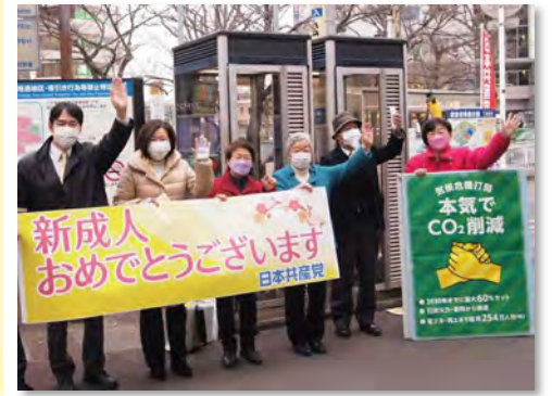
みわ県議と力合わせて頑張ります

みわ県議の存在は本当に頼もしく、この松戸に無くてはならない政治家です。私も心から推薦します。