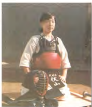
高校生、剣道部のみわ県議

ベトナム戦争に胸を痛み、社会変革の道を志し19歳で日本共産党に入党。99年の県議当選以来、県民の苦しみ・願いに寄り添い県内を走っています。