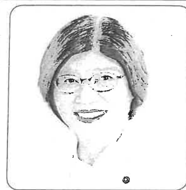
たことが影響しています。

「持を広げてください。よろしく願います。」 「今度は鎌ヶ谷市の市議会議員選挙です。候補者が二人立てられず、一人になったからと言っても大丈夫ではありません。昨年の野田市議選でも、松戸市議選でも、引退した議員の票がそっくりそのまま消えてしまいました。市民の願いを市政に届ける「宝の議席」を守るために、一回り、二回り、支