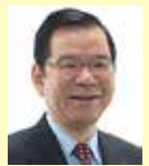
党委員長・衆議院議員 志位 和夫