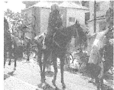
写真: 昨年の市民まつりに参加した相馬野馬追・騎馬武者隊

10月8日(土) 市役所、イオン、交番前付近で模擬店など出店。鎌ヶ谷平和行進実行委員会も出店します。是非お立ち寄りください。(詳細は市広報紙で)