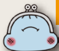
がまぐっちゃん©カクサン部

市がため込んでいるお金(基金)の内、自由に使える財政調整基金はこの3年間で30億円増え約84億円です。市民のくらしを応援し、福祉充実に使うべきです。