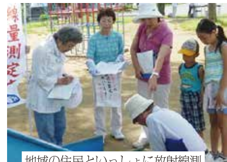
地域の住民といっしょに放射線測定を行う山口市議とみわ前県議