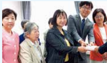
市にコミュニティバス・特養ホームの要請

高校時代から平和運動に取り組み、原水禁世界大会にはこれまで7回も参加しています。高校卒業後、重税に苦しむ中小業者を支援する団体で活躍し、税金や国民健康保険料についても詳しく、頼もしい青年です。