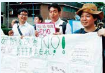
今年6月3日の若者憲法集会に参加

地域ではお年寄りが安心して暮らせるようにと、コミュニティバスの運行や年金で入れる特養ホーム実現めざして頑張っています。まさに、若者から高齢者までなんでも相談できる“最年少”新人です。