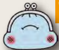
がまぐっちゃん©カクサン部

市がため込んでいるお金(基金)の内、自由に使える財政調整基金はこの3年間で30億円増え約84億円です。市民のくらしを応援し、福祉充実に使うべきです。