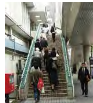
屋根設置が待たれる北小金駅