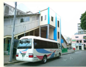
エレベーターとシャトルバス

市議選の公約だったエレベーターが完成。「おかげさまで助かっています」と喜びの声が寄せられています。