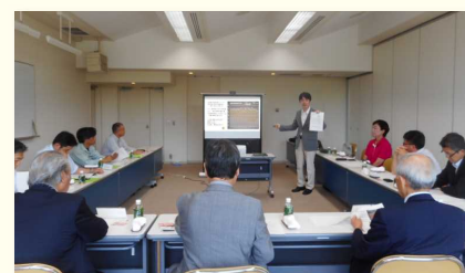
松飛台工業会に道路振動の実態を説明