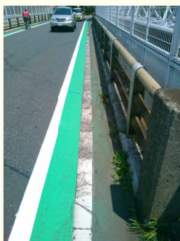
グッと広がり安全に