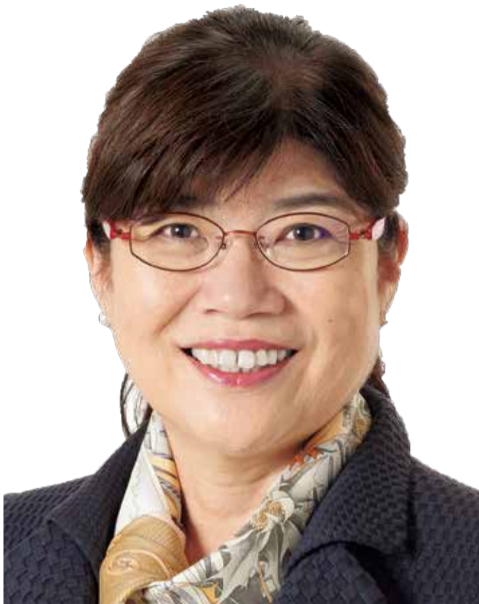
党市医療介護相談室長